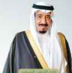
الملك سلمان بن عبدالعزيز آل سعود