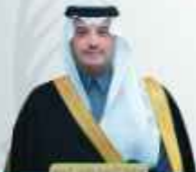
الأمير فهد بن عبدالعزيز آل سعود