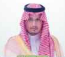
الأمير محمد بن عبدالعزيز آل سعود