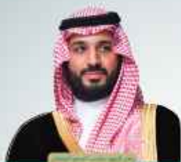
الأمير سلطان بن عبدالعزيز آل سعود