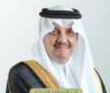
الأمير عبدالعزيز بن عبدالعزيز آل سعود